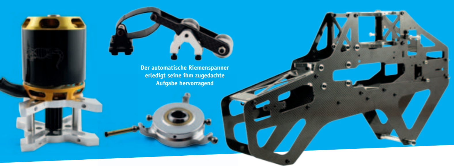
Der automatische Riemenspanner erledigt seine ihm zugedachte Aufgabe hervorragend