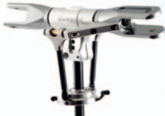
Ein Rotorkopf, wie er sein muss: Zentralstück, Blatthalter, Gestänge – Punkt

der heli Rotordurchmesser: 1.560 mm Länge: 1.372 mm Höhe: 403 mm Abfluggewicht: 5.100 g Rotorblattlänge: 690 bis 710 mm Zähnezahl Ritzel: 13 Übersetzung Motor/Hauptrotor: 10,46:1 Übersetzung Haupt-/Heckrotor: 1:4,8 Preis Barebone: 579,- Euro Preis mit MTTEC-Motor: 749,- Euro Bezug: MTTEC Internet: www.mttec.de