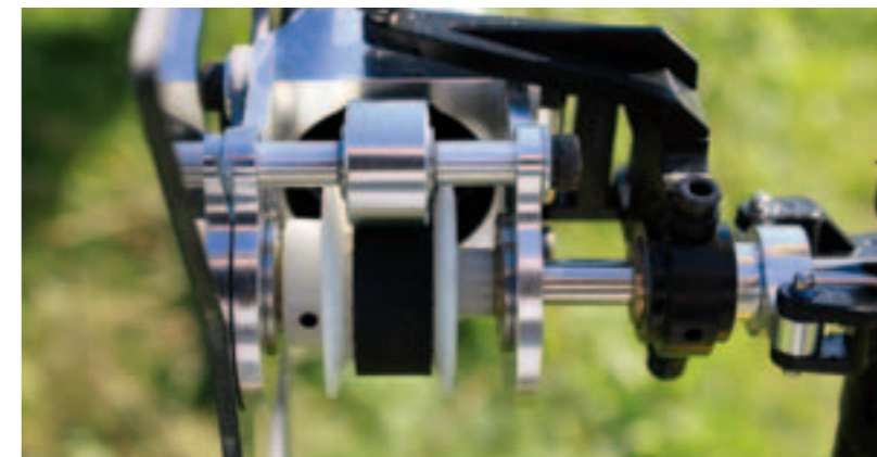
Andruckrollen verhindern ein Überspringen des Riemens bei hohen Belastungen

Zwei 6s-LiPo-Packs mit jeweils 5.000 Milliampere-stunden (mAh) Kapazität konnten nun auf den beiden im Bausatz befindlichen Akkurutschen montiert werden. Auch hier ist eine gute Lösung umgesetzt worden, denn ein fummeliges Anbringen von Klettbandern oder Ähnlichem entfällt. Die Schienen werden von vorne ins Chassis geschoben und mittels eines Bolzens sicher arretiert. Eine Schwerpunktkorrektur wird dabei durch mehrere Bohrungen ermöglicht. So lassen sich auch Akkus mit unterschiedlichen Gewichten einsetzen.