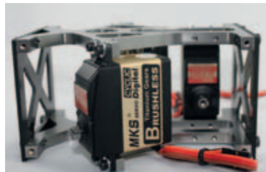
Die Taumelscheibenservos sind am kombinierten Domlager befestigt